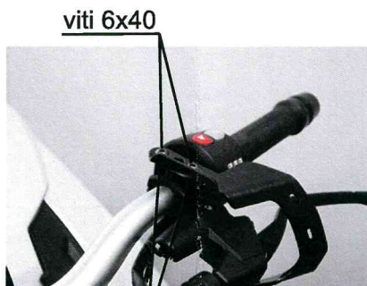
FIG.2 distanziali H17