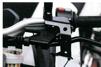
FIG.3 dadi quadri in plastica

Smontare gli pecchi e svitare le viti indicate in fig.1.