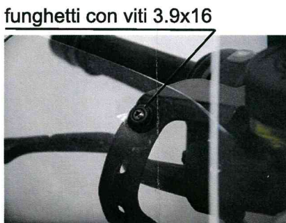
FIG.5 funghetti con viti 3.9x16